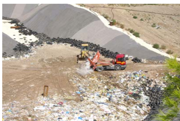
Reciente ampliación del vertedero de Upanel

Desde EU seguimos reclamando un nuevo contrato de basuras y que se lleven las basuras a la planta de residuos de Elche.